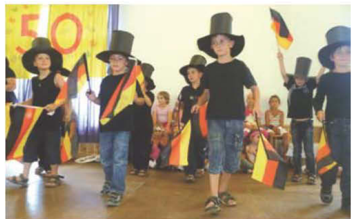
Die Vorschuljungen betanzen das neue Jahrhundert