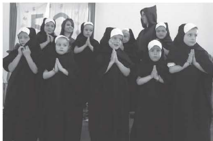
Mädchen erinnern nach einer Melodie aus "Sisteract" an die Klosterschwester, die 38 Jahre den Kindergarten St. Martin leitete