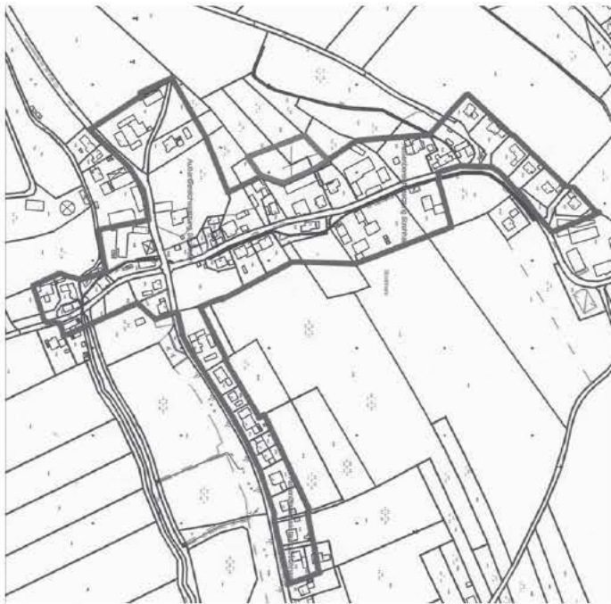
Einbeziehungssatzung „Strohham“ Rot = Erweiterung Blau = Bestand

Im Verfahren wurde der Umgriff der Satzung deutlich reduziert, so dass von Seiten der Raumordnung und Landesplanung grundsätzlich keine Bedenken mehr gegen eine Bebauung im Plangebiet bestehen. Die Satzung über die Einbeziehung von Teilflächen der Grundstücke Fl. Nr. 1238 und 1251 Gem. Kirchdorf a. Inn in den im Zusammenhang bebauten Ortsteil Strohhalm wurde einstimmig genehmigt.