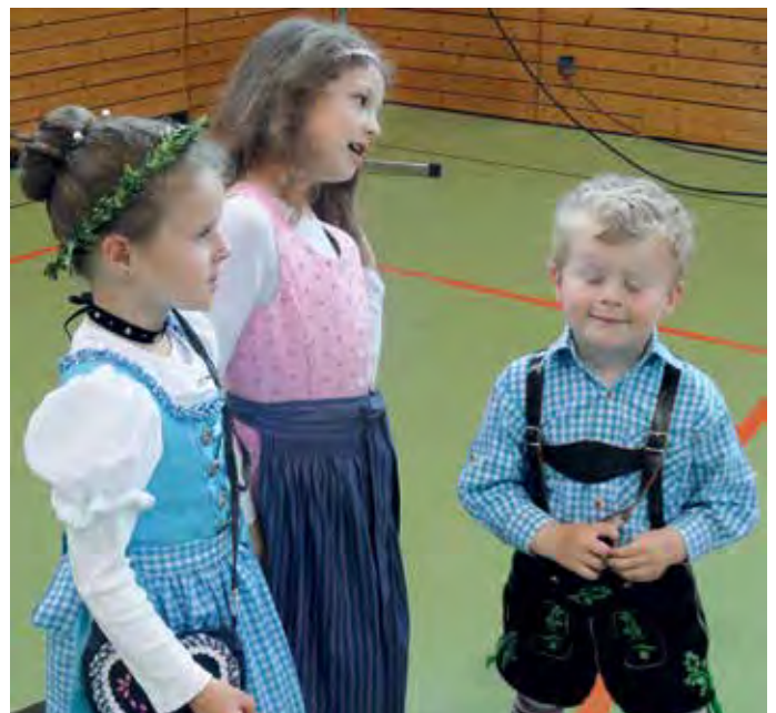
Die jüngsten Besucher des Bayerntages entdeckten im Zuschauerraum ihr Gesangstalent.