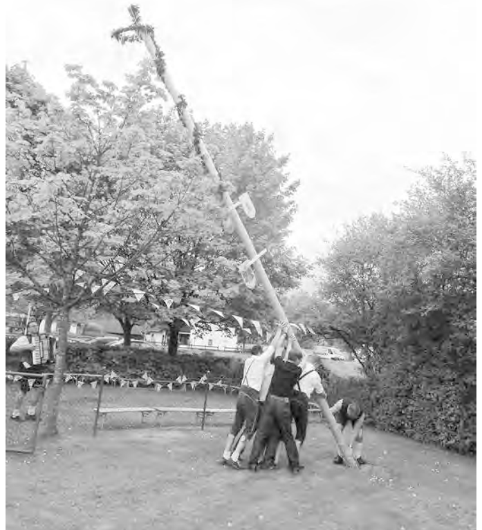
Im Nu hatten kräftige Papas den acht Meter großen Maibaum aufgestellt und abgesichert.

Zum Abschluss ihres rundum stimmigen Programms baten die blutjungen Künstlerinnen: „Erwachsene bleibt's sitzen beim Bier nu im Zelt, mia Kinda mia spuin no in da Spielespaßwelt.“ Gesagt, getan. Bis in den Abend hinein erfreuten sich Jung und Alt am Maifest des Kindergartens „Sonnenschein“ in Machendorf.