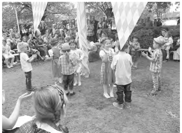
Die verschiedenen Tanzformationen fanden großen Gefallen.