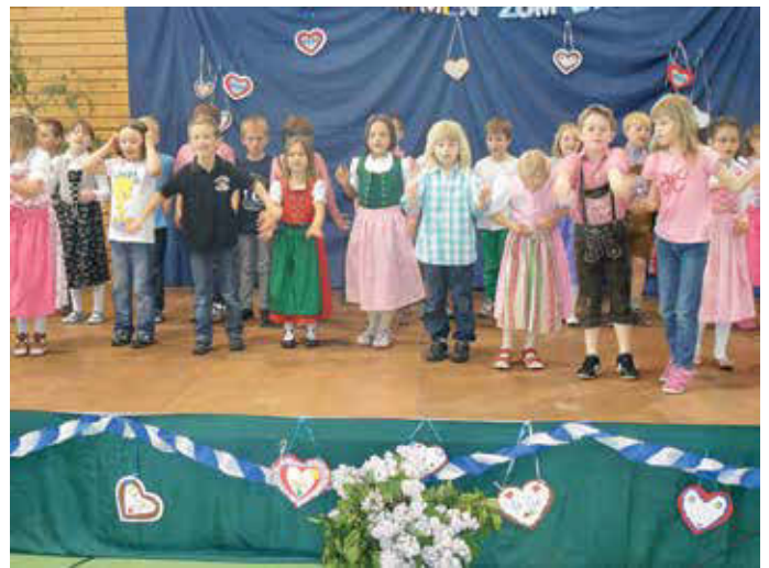
Die Schüler der 1. Klasse begeisterten durch das „Fliegerlied“, das sie fetzig mit Tanz und Gebärdenspiel begleiteten.