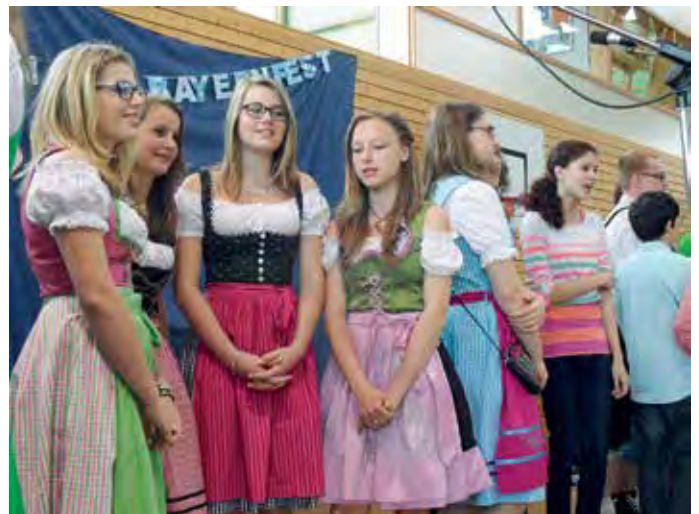
Die Musikgruppen der 7. bis 9. Klassen performten mit Gefühl und Stimme den Hubert von Goisern-Song „Brenna tuats guat!“