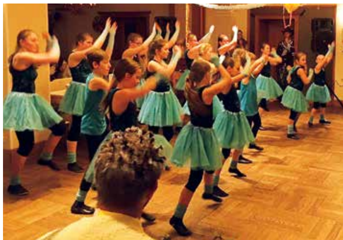
Die „Sensations“ erfreuten die Gäste mit ihrer Aufführung