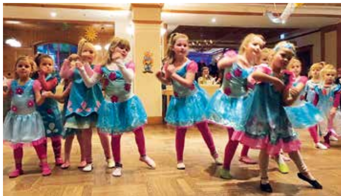
Die Kleinen von „Freed Desire“ hatten ihren großen Auftritt beim TSV-Fasching