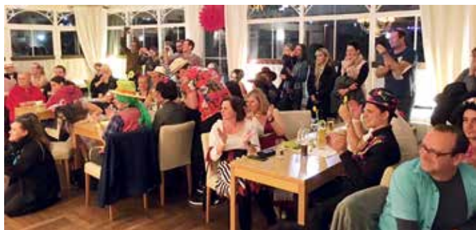
Besucher und Eltern verfolgten die Aufführungen der Kids