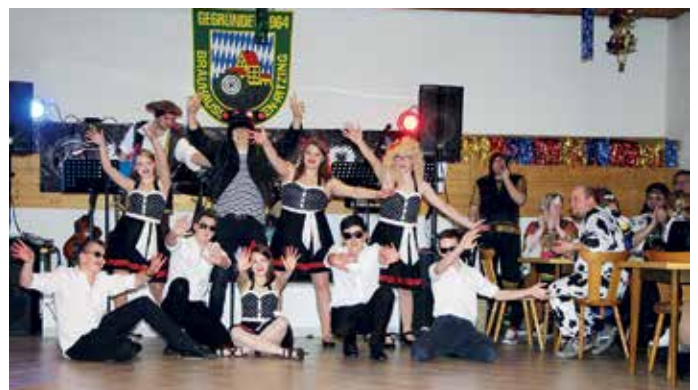
Elvis und Rock´n Roll standen bei der Jugendfeuerwehr im Mittelpunkt

Als weiteres Highlight des Abends war die Showtanzgruppe „Sensations“ aus Julbach zu Gast und zeigte ihr tänzerisches und akrobatisches Können beim Feuerwehrball. Die Bar wurde bestens frequentiert und bis in die frühen Morgenstunden hatten die Besucher das Schützenhaus fest im Griff und feierten bis zum Abwinken. Monika Hopfenwieser