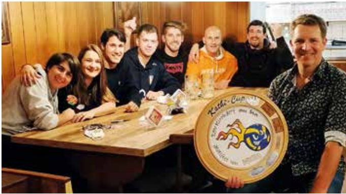
Sieger 2020: Abfahrtskommando Regensburg

Einladung zum 8. KATHI-CUP am Samstag, 16.10.21, Spielbeginn 9:30 Uhr (Begrüßung 9 Uhr), in der Otto-Steidle-Halle / Kirchdorf am Inn.