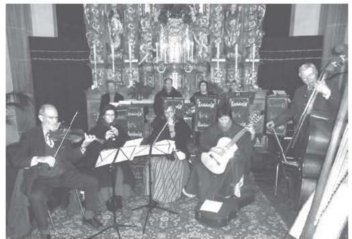
Die Vöcklabrucker Spielleut aus Oberösterreich verbreiteten einen besonderen Klangzauber. Dahinter die Kirchdorfer Musikanten.