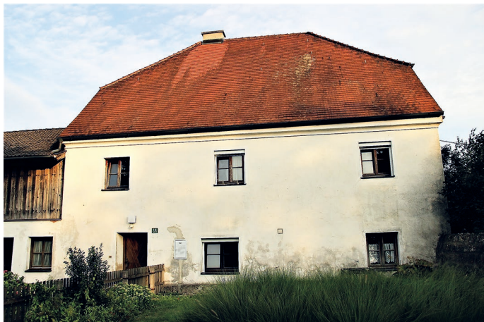
Das heruntergewirtschaftete Haus und die Außenanlagen werden im nächsten Jahr erneuert.

Die Pfarrei Kirchdorf hatte Mitbürgern gegen eine kleine Spende angeboten, dass sie die Begasungsaktion nutzen können, um eigene Möbelstücke vom „Holzwurm“ zu befreien. 10 Personen machten von dem Angebot Gebrauch und stellten Möbel und Holzskulpturen im Mesnerhaus ein.