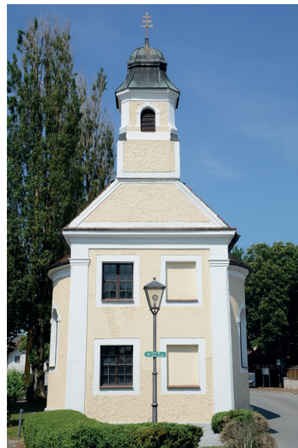
Schlosskapelle am Dorfplatz im Ortsteil Ritzing . Erbaut 1787 von Grafen von Berchem. Seit 1988 im Besitz der Gemeinde Kirchdorf am Inn.

Am Donnerstag den 5. Oktober um 19.00 Uhr findet in der Schlosskapelle eine hl. Messe statt. Um 18.30 Uhr lädt der katholische Frauenbund zum Oktoberrosenkranz herzlich ein. Mit diesem Gottesdienst, dem letzten in diesem Jahr, endet für diese Nebenkirche auch das Kirchenjahr. Text und Bild: Franz Valtl