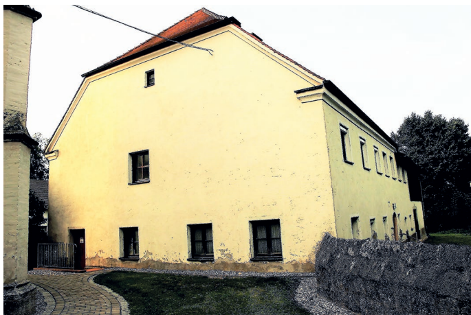
Das Mesnerhaus grenzt direkt an die Kirche (links) an, rechts die ehemalige Kirchhofsmauer.