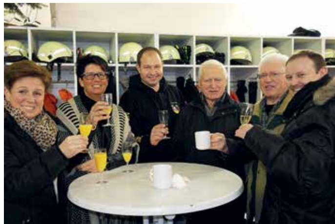
Gut gelaunt prosteten sich die Besucher mit den besten Wünschen für das neue Jahr zu

In seiner Ansprache bezeichnete der Bürgermeister das Jahr 2016 als „paribile“ – viele Menschen hätten eine Würdigung verdient, durch die schrecklichen Ereignisse und erbarmungslose Attentate blieben jedoch Menschlichkeit und Barmherzigkeit auf der Strecke. Wie schön die Natur sein kann, zeige der Silvestertag mit Raureif und winterlichem Erscheinungsbild, meinte Springer und nannte als Gegensatz den 1. Juni als grausame Gewalt der Natur. Die Natur könne man nicht beeinflussen, die Menschen müssten aber daraus lernen, die Schäden beheben und hier sei man auf einem guten Weg. Mit Dankbarkeit und Freude habe er selbst miterlebt, wie die Menschen selbstlos angepackt und mit unbeschreiblicher Solidarität geholfen haben. Was Privatpersonen und Organisationen bei der Flutkatastrophe geleistet haben sei absolut am Limit gewesen. Dafür sprach der Bürgermeister allen seinen aufrichtigsten Dank aus. Er ließ das weltweite Geschehen Revue passieren, ging u.a. auf den EU-Austritt von Großbritannien, die Präsidentenwahl der USA und die Zuwanderung, welche noch viele Jahre ein Thema sein wird, ein und hofft, dass, wenn man auch die weltpolitische Entwicklung nicht voraussehen kann, alles ins Lot kommt.