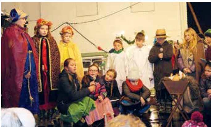
Auch die heiligen drei Könige kamen, um das Jesuskind zu sehen

Ihr schauspielerisches und musikalisches Können stellte die Grundschule Kirchdorf bei ihrem Krippenspiel „Heute leuchten alle Sterne“ unter Beweis. Sie spielten eine Gruppe Hirten mit Frauen, denen auf dem Feld ein Engel erschien und die sich auf dem Weg zum Stall nach Bethlehem machten – als Gaben legten sie dem Jesuskind drei Schaffelle in die Krippe. Von den Geschehnissen der Heiligen Nacht bis hin zur Ankunft der heiligen drei Könige brachten die Schüler alles mit Bravour zum Ausdruck.