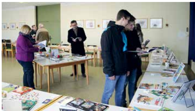
Die neuen Bücher wurden im Pfarrzentrum vorgestellt.

Die Bücherei hat Nachwuchs bekommen. Es handelt sich dabei um insgesamt 145 Bücher sowie 15 Tonträger (DVDs und CDs). Der Lesestoff teilt sich auf in 55 Kinderbücher, 25 Jugendbücher, 33 Romane und Krimis, außerdem 32 Sachbücher zu unterschiedlichen Themen. Die "Neuankömmlinge" wurden am 18.12. im großen Saal des Pfarrzentrums St. Konrad vorgestellt und stehen zum Ausleihen zur Verfügung.