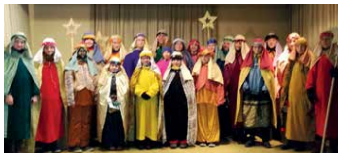
Die 22 Kirchdorfer Sternsinger in ihren bunten Gewändern nach der Einkleidung im Pfarrzentrum St. Konrad.