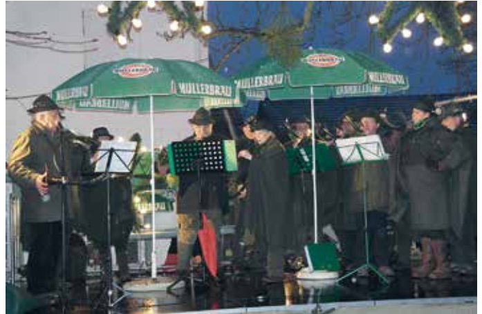
Die Jagdhornbläser der Kreisgruppe Pfarrkirchen spielten u.a. das große Hallali