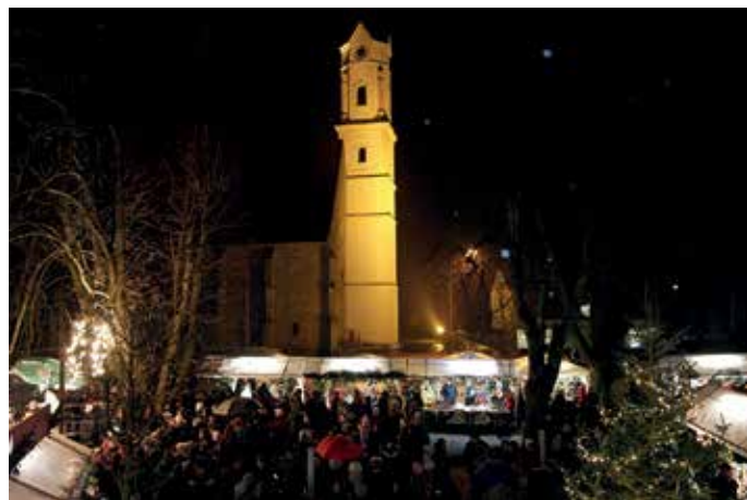
Ein herrliches Ambiente – der Kirchdorfer Christkindlmarkt mit beleuchteter Kirche im Hintergrund