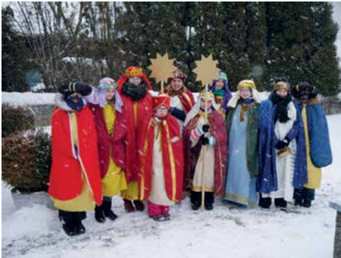
Die Sternsinger aus Seibersdorf waren trotz Schnee und eisigem Wind fleißig unterwegs