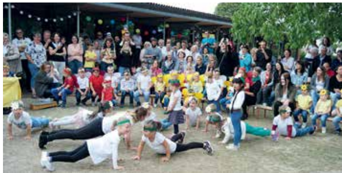
Die weißen Margeriten zeigten, wie fit sie sind