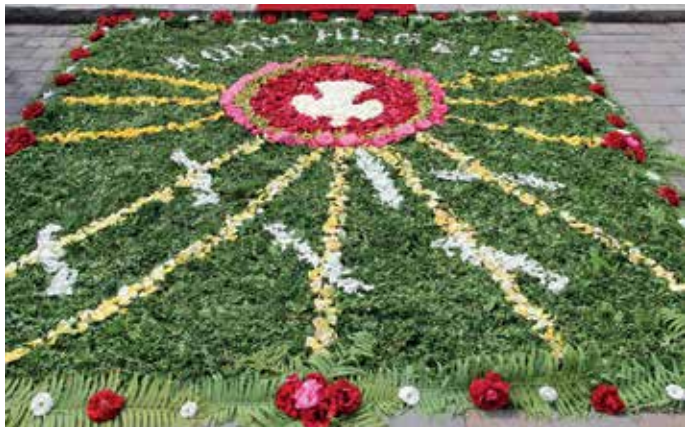
Der Blütenteppich vor dem Altar am Kriegerdenkmal.

Nachdem die Prozession in die Pfarrkirche zurückgekehrt war, spendete Pfarrer Kovács dort mit dem Allerheiligsten den feierlichen Schluss-Segen. Das Hochfest klang mit dem gemeinsam gesungenen Lied „Großer Gott, wir loben Dich“ aus.