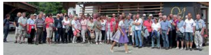
90 Teilnehmer aus Kirchdorf und Julbach genossen den Ausflug in die Dachsteinregion mit ihren Eigenheiten.

Über Golling, Ostermiting und Burghausen ging es am frühen Abend, voll bepackt mit neuen Einblicken, zurück in die Heimat.