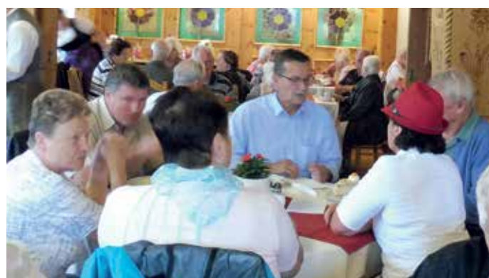
Auf der Heimfahrt wurde Rast in Marquartstein gemacht.

Auch in diesem Jahr veranstaltete die Gemeinde wieder einen Tagesausflug mit den Seniorinnen und Senioren. Bei bedecktem Himmel wurde mit zwei vollbesetzten Bussen in Richtung St. Johann in Tirol gestartet. Die traditionelle Frühstückspause mit Brotzeit und Getränken nach freier Auswahl (gestiftet von der Seniorenbeauftragten und vom Bürgermeister) wurde in Inzell eingelegt – leider entluden ab diesem Zeitpunkt die grauen Wolken ihre Fracht und der Regen wurde für den Rest des Tages Wegbegleiter. Anschließend ging es weiter über den Steinpaß nach Lofer, Waidring zum Zielort St. Johann.