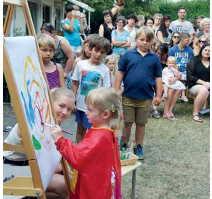
Musikalisch inspiriert schafften die kleinen Maler ein Kunstwerk