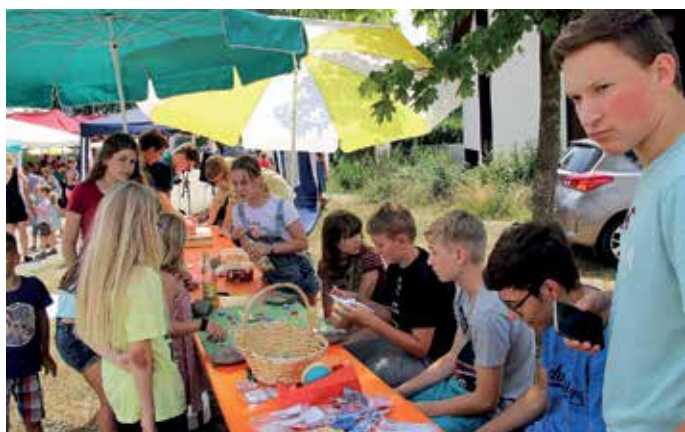
Beim Stand der Ministranten, die eine Pfarrei-Rallye veranstalteten, war viel los.

Heuer passte wirklich alles bestens zusammen: das durchgängig schöne Sonnenwetter, ein breitgefächertes Angebot an Speisen und Getränken, viele Beschäftigungsmöglichkeiten für Kinder, eine fesche und gar nicht aufdringliche Unterhaltungsmusik, der flotte Service und keine Konkurrenz durch andere Feste. Die Ess- und Getränkestände waren gut verteilt, so dass es zu keinerlei Staus bei der Magenversorgung kam. Rund 20 Personen von Pfarrgemeinderat, Kirchenverwaltung und Frauenbund waren im Einsatz, um den gut 500 Besuchern ein Pfarrfest in gemütlich-fröhlicher Atmosphäre zu bieten, in dem neben Essen, Trinken, Spaß und Spiel auch genügend Raum blieb für persönliche Gespräche.