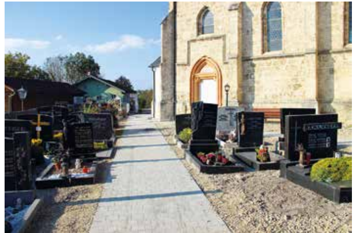
Gepflasterte Wege werden in Zukunft das Gehen auch bei schlechtem Wetter erleichtern.