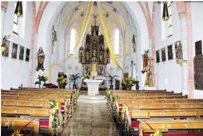
St. Jakobus der Ältere strahlt im neuen Gewand

Die gesamte Renovierung mit Befestigung der Gehwege im Bereich der Kirche und des dazugehörigen Friedhofes kostet insgesamt 43 419 Euro. Davon entfallen auf die Innenrenovierung der Kirche mit Sturzsicherung beim Aufgang zum Orgel- und Sängerbereich 8 419 Euro, die von der Kirchengemeinde Seibersdorf bezahlt wurden. Hinzu kommt ein 35 %-Anteil von 12 250 Euro an den Investitionen von 35 000 Euro für die Pflasterung der Gehwege, so dass die Seibersdorfer Kirchengemeinde insgesamt 20 669 Euro bezahlt. Die Diözese Passau übernimmt 65 % der Kosten (22 750 Euro) für die Gehwege.