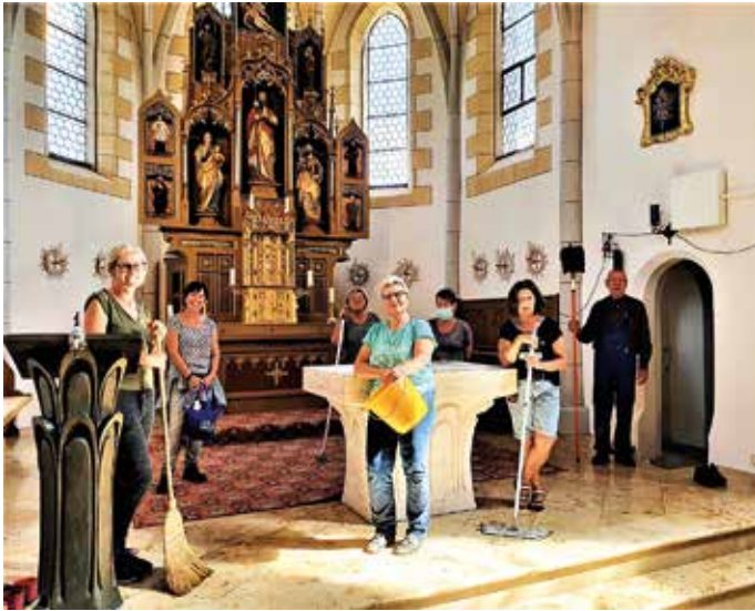
Die Reinigungskolonie des Frauenbundes war engagiert im Einsatz.

lädt zu Gottesdienst und persönlichem Gebet ein.