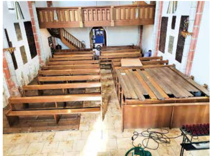
Bei Vorbereitungsarbeiten für den Einsatz der Renovierungsfirma.

ke stehen, um zwei Zentimeter zurückgeschnitten, damit es nicht mehr an der Mauer ansteht. Schließlich deckten fleißige HelferInnen den Hochaltar, die Sängereмпore mit der Orgel sowie die demontierten Sitzbänke mit Folien ab.