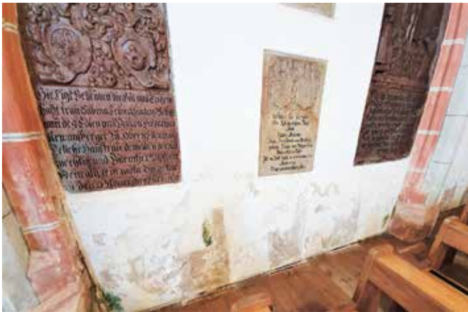
So sahen Teile der Kirche vor der Renovierung aus.

Nachdem der Zahn der Zeit wieder tätig geworden war, beschloss die Kirchenverwaltung im März 2018 das schadhafte Mauerwerk auf der Wetterseite renovieren zu lassen. Es löste sich großflächig ab und zeigte hässliche Verfärbungen. Beim Baureferat der Diözese Passau wurde mehrfach wegen einer Renovierung nachgefragt, aber bis zum Frühjahr diesen Jahres tat sich nichts. Am 03. Juni 2020 erhielt die Expositur schließlich die rechtliche Genehmigung der Stiftungsaufsicht für die Innenrenovierung der Kirche – allerdings ohne Kostenbeteiligung durch die Diözese. Die Kirchenverwaltung beschloss daraufhin, die Maßnahme in die großen Ferien im August zu legen, da in dieser Zeit kaum Gottesdienste stattfinden.