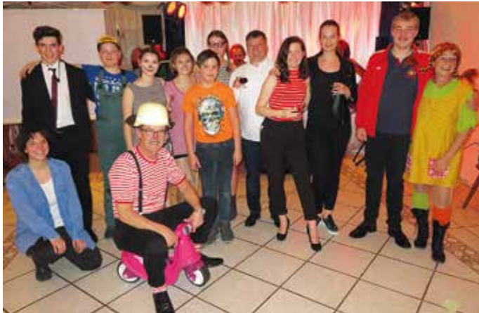
Die Jungfeuerwehler beim Sketch von der Partnersuche zum Barbesuch. Der Bürgermeister bekommt sogar ein Bobbycar dazu Text: Irmgard Braunsberger

wurde. Die stets gut gefüllte Bar zog viele Besucher an und auch die Tombola, bei der es jede Menge schöne Preise zu gewinnen gab, lockte zum Loskauf. Der abschließende Dank der Vorsitzenden Gitte Haunreiter galt allen Spendern der Tombolapreise, den Mitwirkenden und grundsätzlich allen, die zum Gelingen des tollen Faschingsballes beigetragen haben.