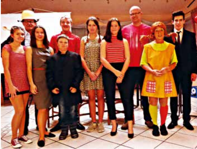
Die großen Dorfspatzen bei ihrem Vortrag.