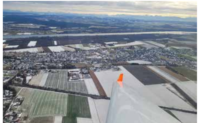
Wir haben eine schöne Landschaft – auch im Winter!