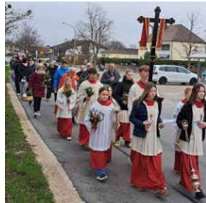
Prozessionszug vom Jubiläumskreuz zur Pfarrkirche

Obwohl das Wetter alles andere als erfreulich war, wurde der erste Teil des Palmsonntags im Freien abgehalten. Bereits vor der Kirche „Maria Himmelfahrt“, und dem „alten“ Seniorenheim St. Josef waren Verkaufsstische aufgestellt, um