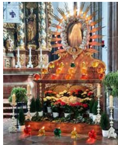
Das Heilige Grab nach der Karfreitag-Liturgie

Am Karfreitag-Vormittag hatten die Mitglieder der Kirchenverwaltung und des Pfarrgemeinderates im Altarraum das Heilige Grab aufgebaut in Vorbereitung auf die Liturgie am Nachmittag.